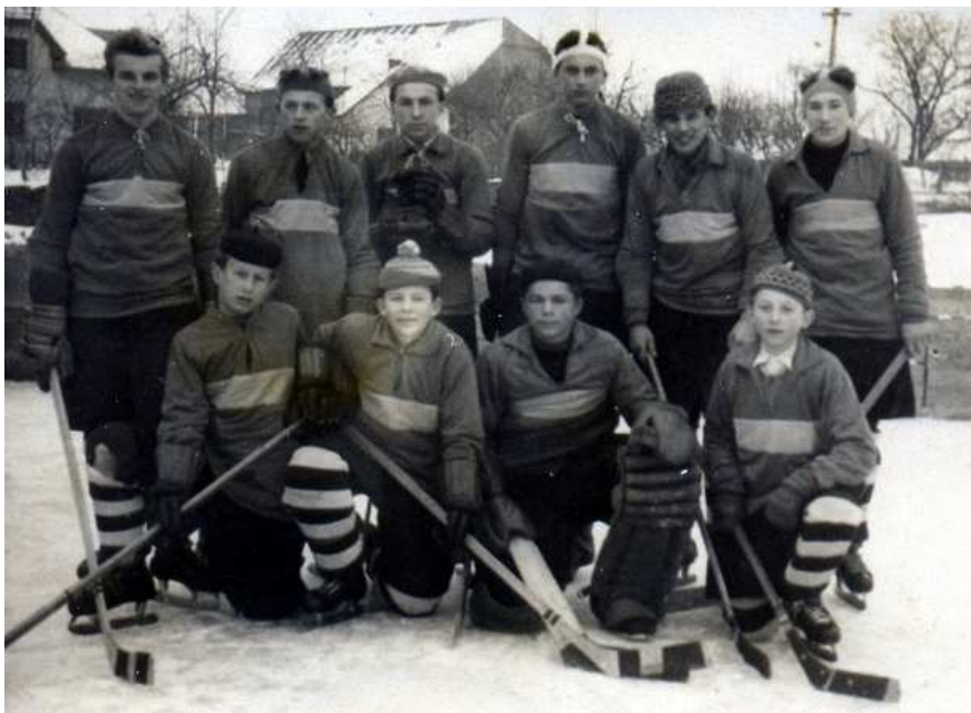
dorostenci TJ Sokol Bezděkov

Žádost o příspěvek na stavební údržbu z 28. 10. 1957 na ČSTV v Pardubicích: „Je nutné zvýšit mantinely. Jeden hráč upadl a nalomil si dvě žebra...“