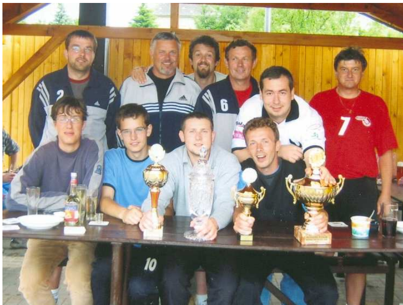
volejbalisté s trofejemi