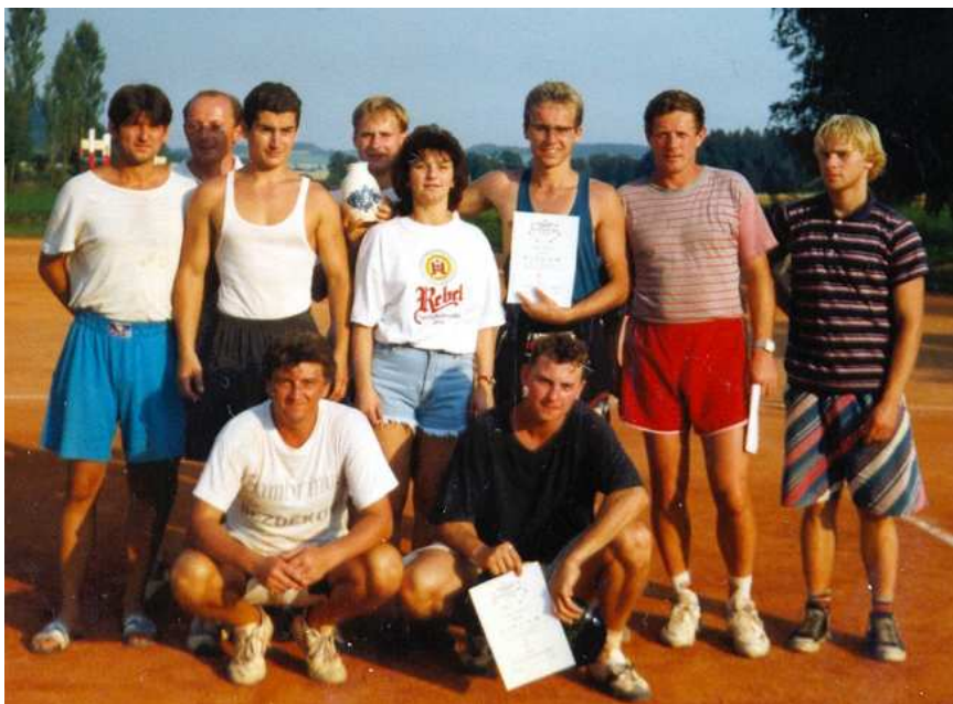
Nohejbalisté na turnaji v Bezděkově