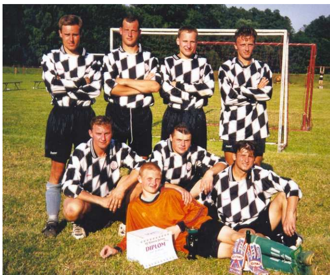
2. místo na turnaji v Jeřišně.

Fotbálek? Bezděkov vyhrál turnaj v Nové Vsi a v Jeřišně byl druhý.