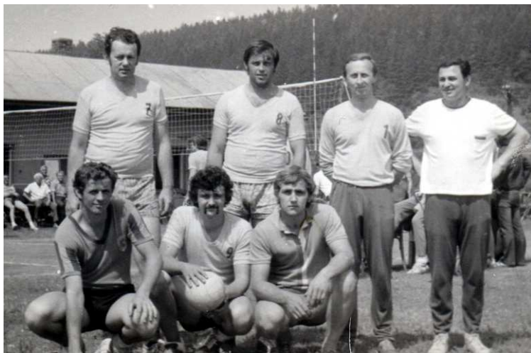
Vítězové bezděkovského turnaje