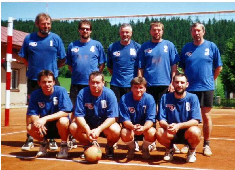
Vítězové KP II. třídy